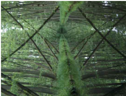
Huch, was ist das? Ein Vexierbild?