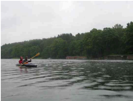
Bootshäuser im Regen