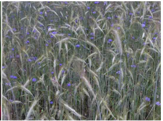
Getreidefeld mit Kornblumen