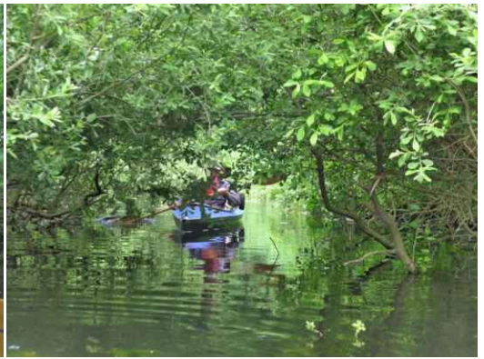
Enger Durchlass in die Schwaanhavel