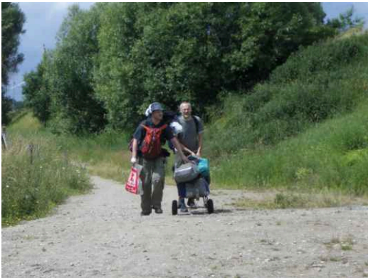
Anmarsch der Boote.

Abfahrt war früh 7:09 Uhr, damit wir 13:15 Uhr schon in Kratzeburg sind und noch was vom Tag haben. Die Anschlüsse funktionieren alle und wir kommen pünktlich an. In Neubrandenburg werden noch Vorräte für 3 Tage gefaßt. Wir haben ja sonst kaum was zu schleppen. ;-)) Auf dem Weg zur Aufbau-Wiese am Bahndamm Kratzeburg überqueren wir die Havel als Rinnsal.