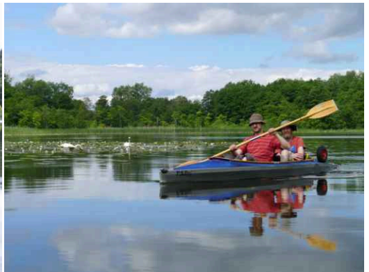
Schwäne und Schwanfotografen