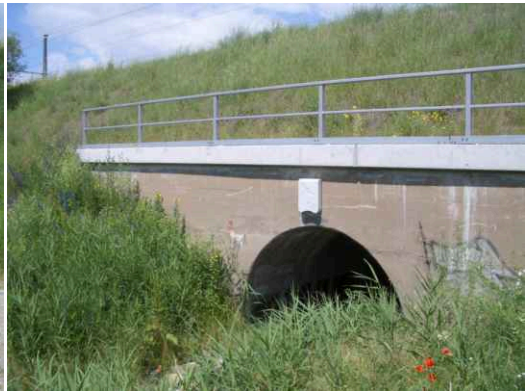
Unter dem Bahndamm fließt die Havel durch. Die Quelle ist nicht weit entfernt.

Wir bekommen die Boote zügig zusammengebaut und stechen gegen 15 Uhr in See. Den Käbelicksee, um genau zu sein. Das Wasser ist leicht bewegt. Wir paddeln über mehrere kleine Seen, die durch kurze Stücke der Havel verbunden sind. Strömung gibt es keine, wir müssen selber ran.