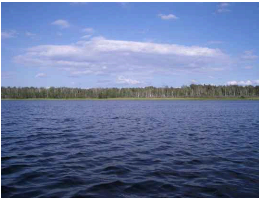
Das perfekte Blau des Zotzensees.