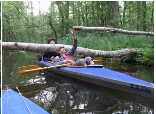
Limbo in der Schwaanhavel